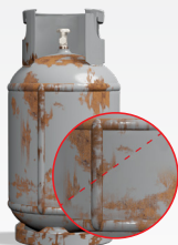
wykonanie 3 – szwowe