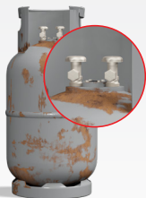
zawór podwójny lub niekompletny