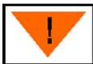
Nr 13 (RID) – Przetaczać ostrożnie.